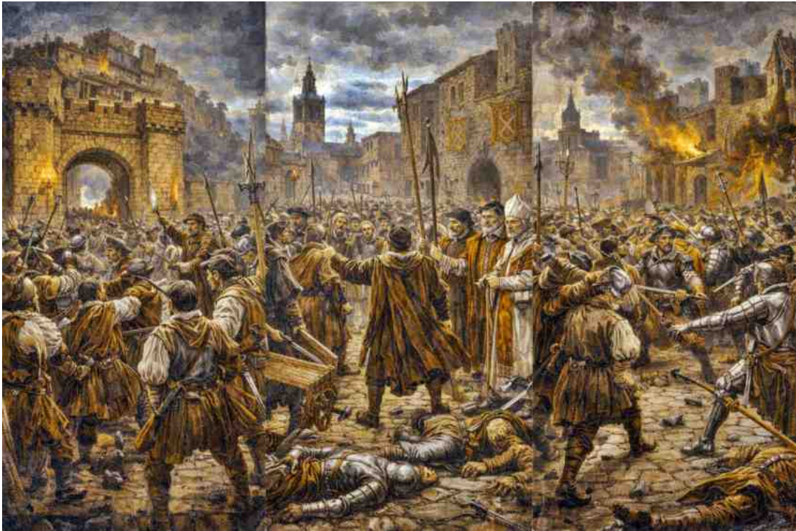
La revolta s'estén pel Regne

Xàtiva, Alzira, Gandia i atres focs agermanats