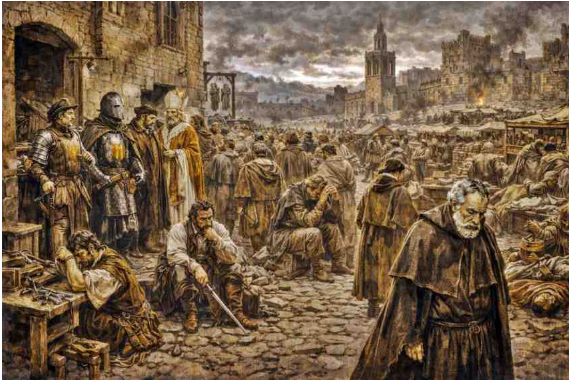
Un Regne canviat