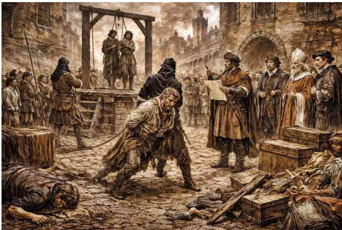
Justícia, castics i persecucions

Quan la Germania Valenciana començà a perdre força militar, la resposta de la Corona no es llimita a recuperar el control polític del Regne de València. El següent pas fon la repressió. Una repressió pensada no sols per a castigar als principals líders agermanats, sino també per a enviar un message clar a tota la societat valenciana: qualsevol desafiament a l'orde establert tindria conseqüències severes.