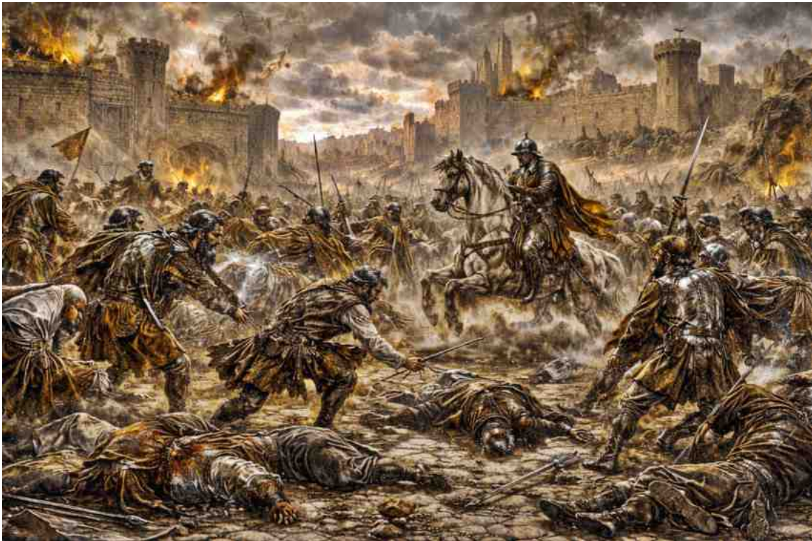
Les batalles decisives