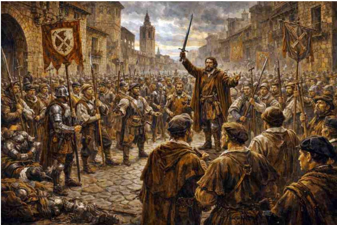
La germanor dels gremis