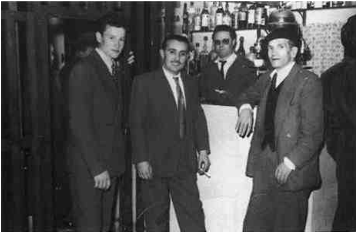
El bar del vestíbul del TEATRO CIRCO, amb la tanca que dividia el públic de general i el de butaca preferent (J.M. Mulet).

Quizás, por esta imagen final, mucho más modesta y diferente a la visión inicial, el Gran Teatro Circo nunca llegó a ser conocido como el Teatro Circo que Alfonso Garín había imaginado y soñado. La realidad de la construcción reflejó las limitaciones económicas, técnicas y quizás también las decisiones de los responsables, que priorizaron aspectos prácticos sobre la estética y la grandiosidad proyectadas. Así, aquel proyecto quedó marcado por una especie de contradicción entre el sueño original y la realidad material, dejando en el imaginario colectivo la sensación de lo que pudo haber sido y nunca fue.