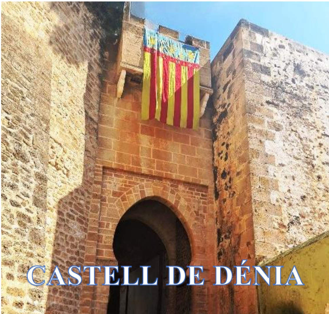
CASTELL DE DÉNIA