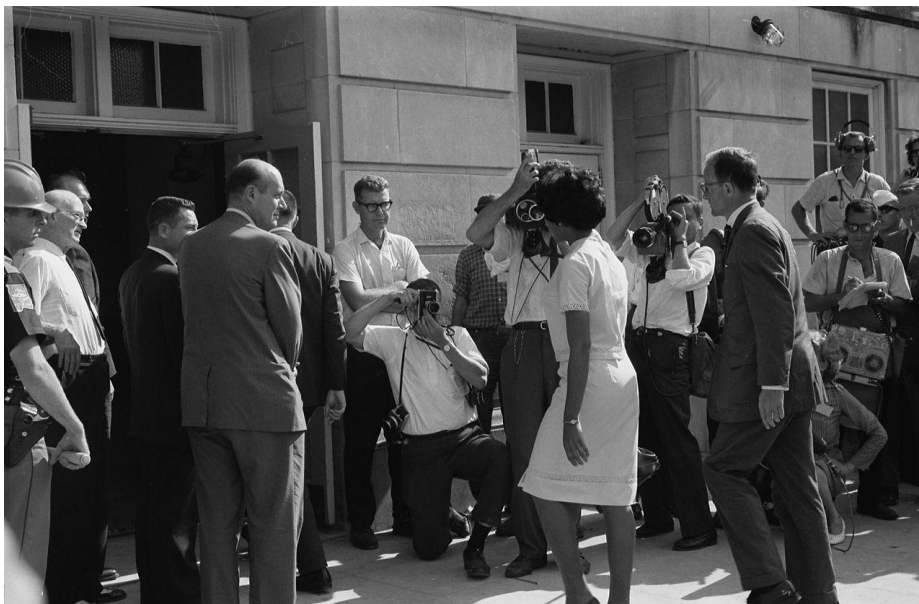
Vivian Malone Jones llega para inscribirse para clases en el Auditorio Foster de la Universidad de Alabama.

El 11 de junio, Malone y Hood llegaron para inscribirse. Wallace, intentando mantener su promesa como también producir un incidente político, bloqueó la entrada del Auditorio Foster mientras representantes del periodismo presenciaban la escena. Entonces, el Deputy Attorney General Nicholas Katzenbach, que se encontraba escoltado por policías federales le indicó a Wallace que despejara el