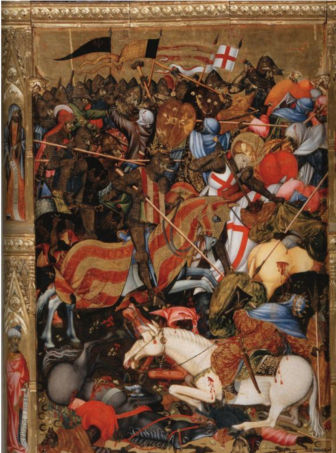
Tabla completa de la batalla del Puig 3 . Detrás del monarca, Jaime I vestido con el Señal Real de Aragón, aparece San Jorge cuyas vestiduras blancas y las de su caballo con la cruz roja. Al fondo de la escena, en la tabla completa pueden verse las banderas del rey de Aragón, con dos palos, y la de San Jorge.

banderas del rey de Aragón, con dos palos, y la de San Jorge. Londres. Victoria and Albert Museum. Pintura al temple sobre tabla. Hacia 1410 - 1420.