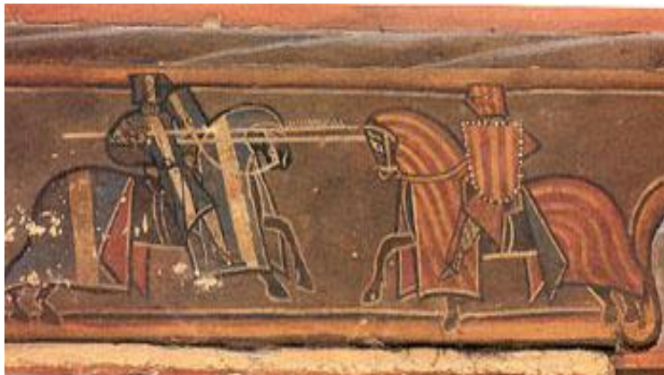
Representación de un combate entre dos caballeros. El de la derecha presenta su escudo y yelmo, además de las gualdrapas de su caballo, con “ el señal real de Aragón ” Teruel. Techumbre mudéjar de la catedral. Hacia 1280 – 1300.

En 1850, el literato catalán M. Milá i Fontanals utiliza aún en sus escritos el término “ Llemosí ” para referirse a su lengua, la lengua actual catalana. Cuatro años más tarde en 1854, el Padre de la Romanística, el filólogo alemán Friedrich Díez, publica su “ Diccionario etimológico de las Lenguas Románicas ” en el que hace su estudio etimológico. En este estudio histórico-comparativo de las lenguas románicas Friedrich Díez llega a la conclusión de que la Lengua Valenciana y el Occitano eran la misma lengua. Y llega a dicha conclusión tras el estudio comparativo de las obras de nuestros clásicos del Siglo de Oro valenciano, Jaume Roig y Ausias March con obras de otros autores de menor relevancia del diastema occitano-románico.