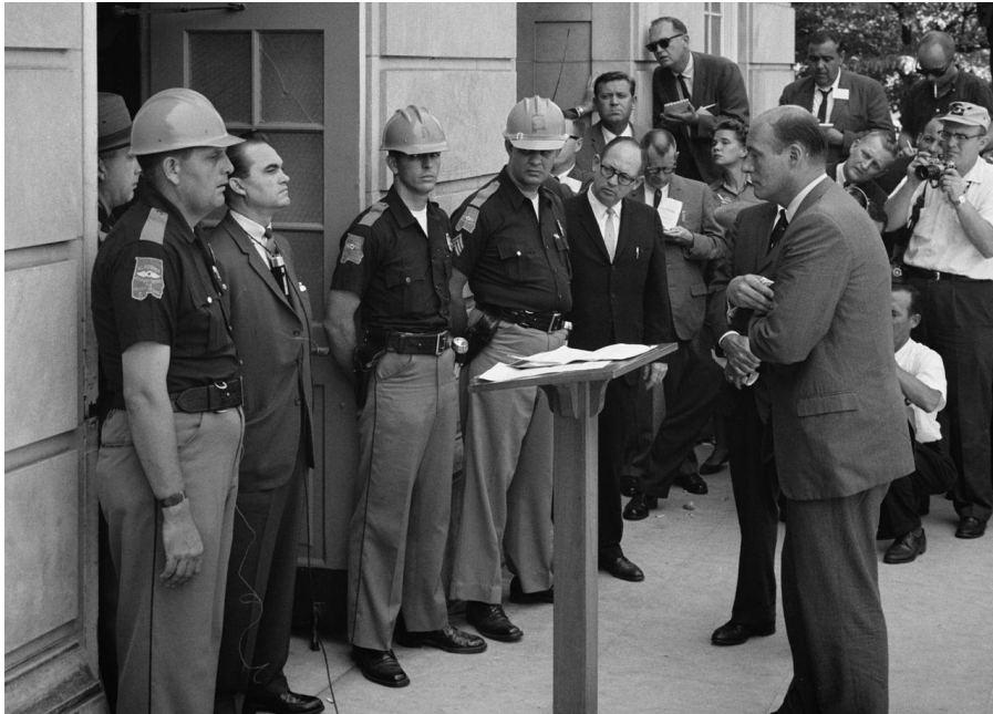
El gobernador George Wallace, intentando bloquear la integración en la Universidad de Alabama, se encuentra parado en actitud desafiante en la puerta del Auditorio Foster ante el Deputy U.S. Attorney General Nicholas Katzenbach.

puerta del auditorio para intentar bloquear la entrada de dos estudiantes negros, Vivian Malone Jones y James Hood.