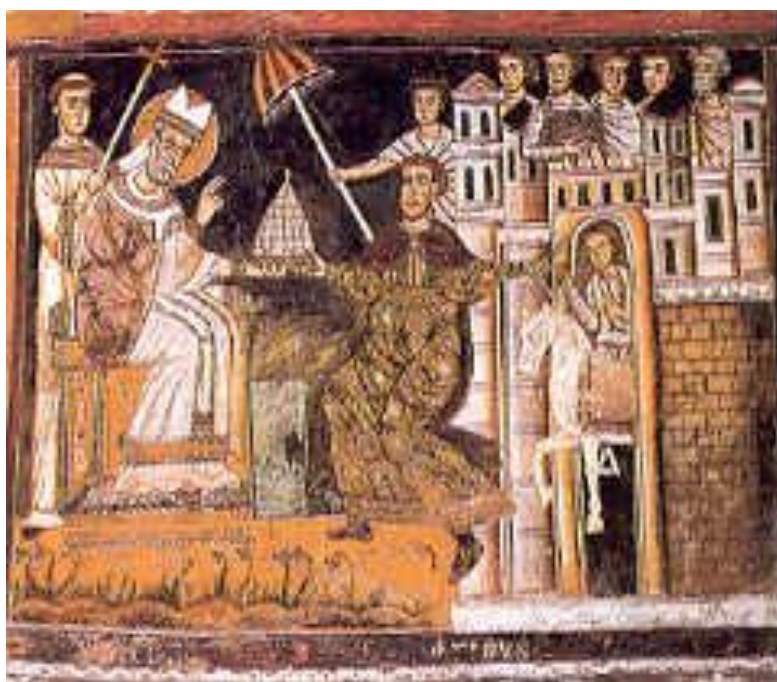
Escena en la que se representa la entrega de la tiara por el emperador Constantino al papa Silvestre II. Obsérvese la umbrella pontificia, con los colores rojo y amarillo, que protege y cobija al emperador. Roma. Iglesia de los Cuatro Santos Coronados, frescos de la capilla de San Silvestre. Mediados del siglo XIII.

Teodoro Llorente, con encontradas opiniones sobre el modelo de lengua preferido y que tenía enfrente a Bernat i Baldoví, a Escalante y a otros y en medio a Constantí Llombart, fundador de la sociedad de amantes de las glorias valencianas Lo Rat Penat , intentando recoger las dos tendencias. Pero, por supuesto, no cabía duda en ninguno de los casos sobre la denominación de Lengua Valenciana , dado su acreditado pedigrí histórico.